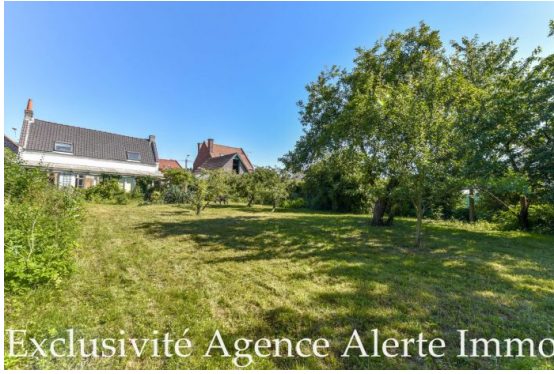
Exclusivité Agence Alerte Immo