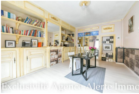
Exclusivité Agence Alerte Immo